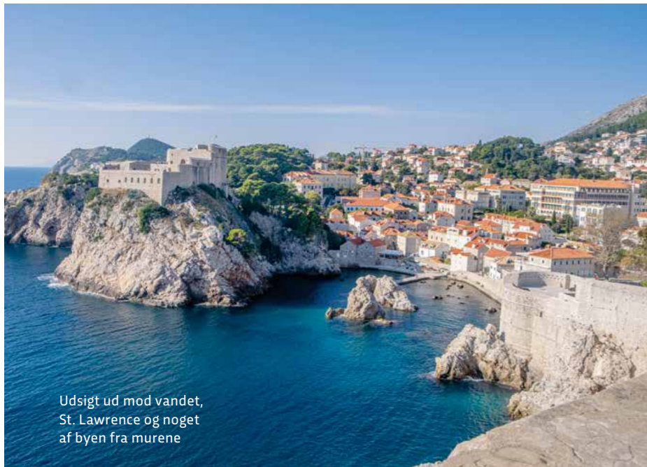
Udsigt ud mod vandet, St. Lawrence og noget af byen fra murene