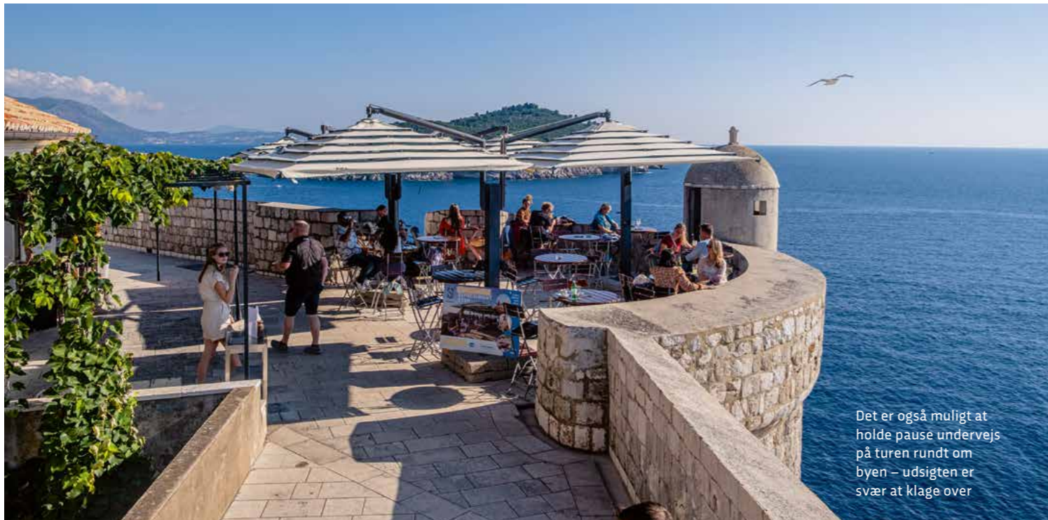
Det er også muligt at holde pause undervejs på turen rundt om byen – udsigten er svær at klage over