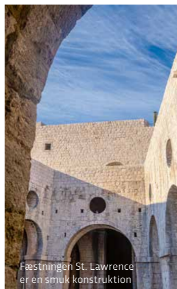
Fæstningen St. Lawrence er en smuk konstruktion

Bagefter går vi tilbage ud ad porten og følger et skilt til St. Lawrence. Når man allerede har betalt for at gå på muren, er indgangen til fæstningen gratis. Den emmer af en ukendt historie. Flere gange leder jeg efter skilte, der