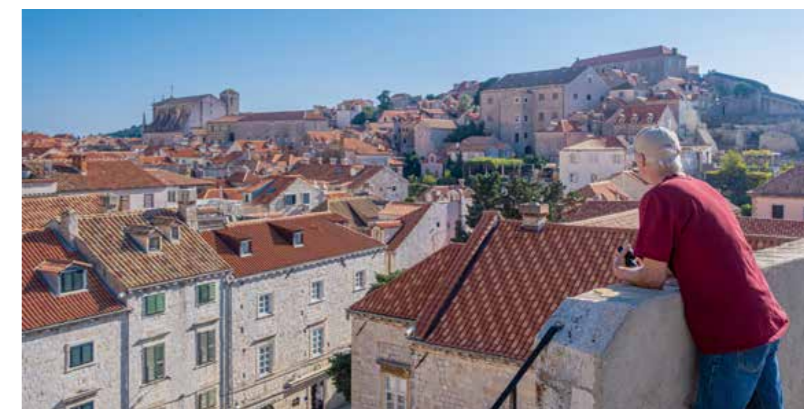
Murene nås først, når man er gået op ad en stejl bakke. Vi er ikke de eneste, der lige skal have pusten, før vi går videre

Et must i Dubrovnik er at opleve byen fra toppen af de gamle mure. Det koster 200 kuna (ca. 200 kr.) at få adgang. Trapperne opad er stejle, og vi puster, da vi når toppen af muren. En pil indikerer, at ruten er ensrettet, og så begynder vi ellers at gå. Der hænger tøjsnore med sengetøj og T-shirts ud fra vinduer og på altaner på den ene side, mens havet udgør kulissen på den anden. Undervejs holder