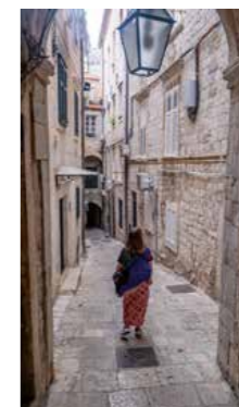
Gaderne er smalle i Dubrovniks gamle bydel. De hænger sammen på kryds og tværs, og det kan være svært at finde rundt