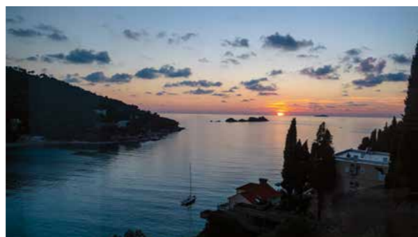
Dubrovnik ligger på Dalmatiens kyst ud til Adriaterhavet. Her udsigten fra Hotel Kompas

Tilbage på gågaden strømmer parfumedufte fra en af de mange små delikatessebutikker. Vi går