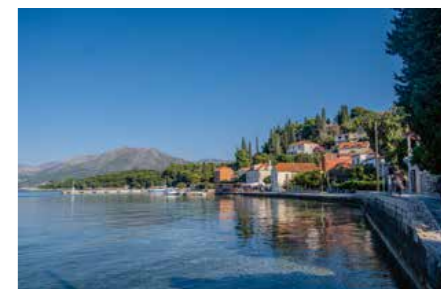
Man kan også opleve Dubrovnik fra vandsiden. Her besøjer vi en af Elaphiti-øerne, der ligger smukt med krystallkalt vand på alle sider