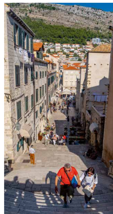
Dedikerede Game of Thrones-fans vil i den gamle bydel opleve, at flere steder virker bekendte. Bl.a. denne trappe, som Cersei Lannister stod på lige før sin berømte gang gennem byen

re. Vi forventede, at Dubrovnik var turistfattig uden for højsæsonen, men den idé gøres til skamme, da vi ankommer til den gamle bydels indgang ved Pile Gate. Uden for gangbroen, der fører ind mellem stenmurene, stimler folk sammen. Vi går hen og kigger på vandet, der dovent skulper rundt om nogle høje stenklipper, før vi følger menneskemængden og lader de store stenmure omfavne os.