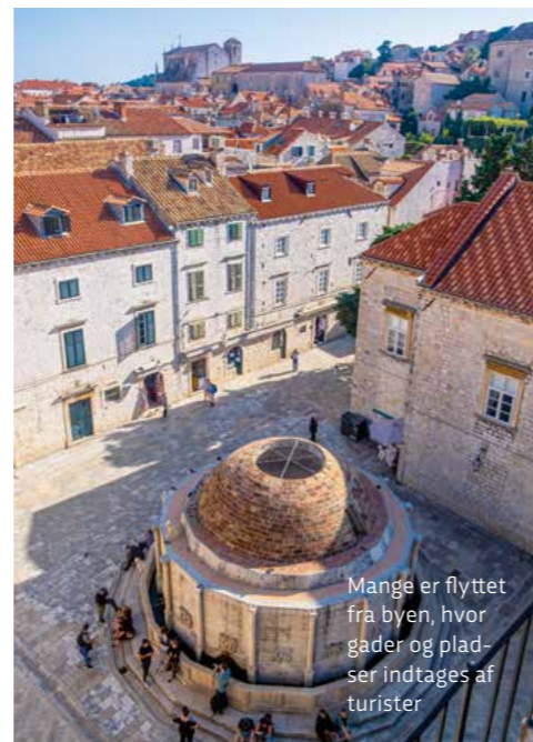
Mange er flyttet fra byen, hvor gader og pladser indtages af turister