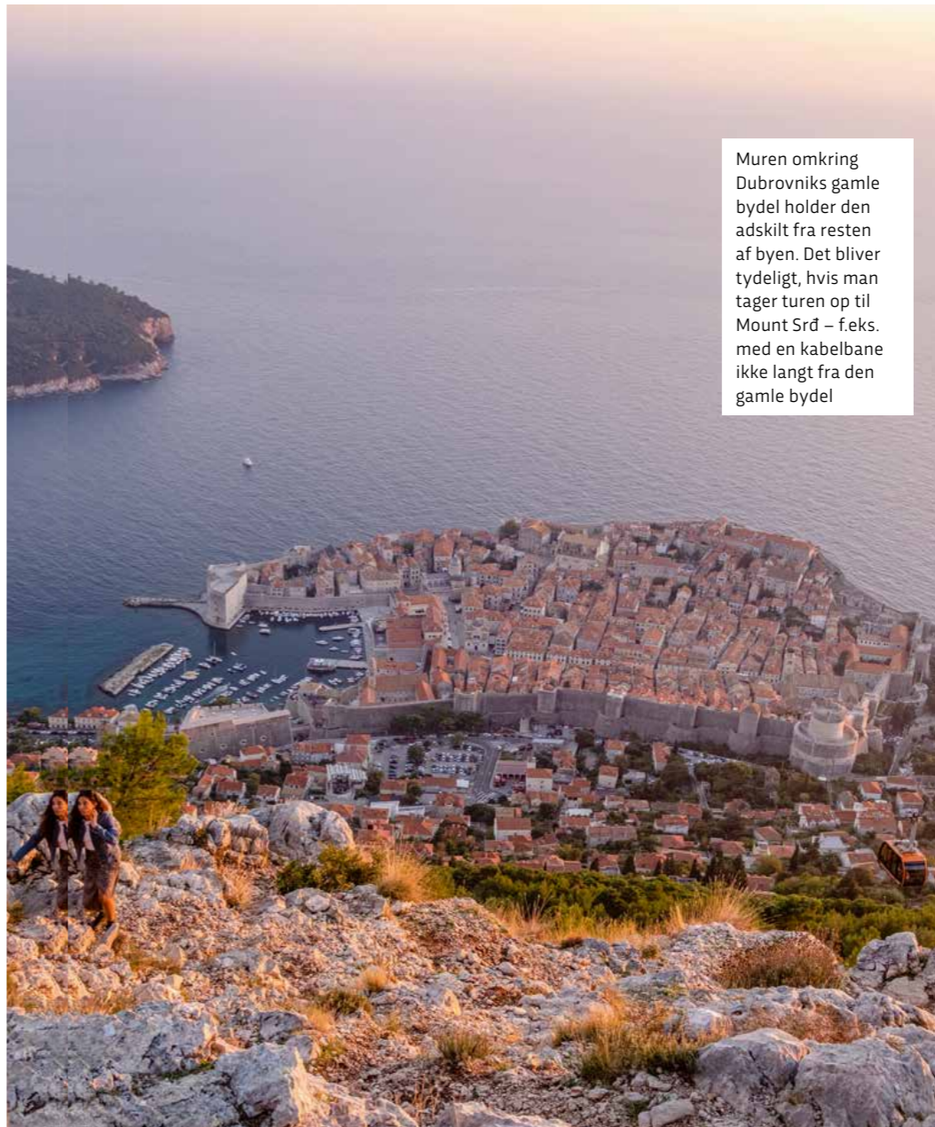
Muren omkring Dubrovniks gamle bydel holder den adskilt fra resten af byen. Det bliver tydeligt, hvis man tager turen op til Mount Srđ – f.eks. med en kabelbane ikke langt fra den gamle bydel