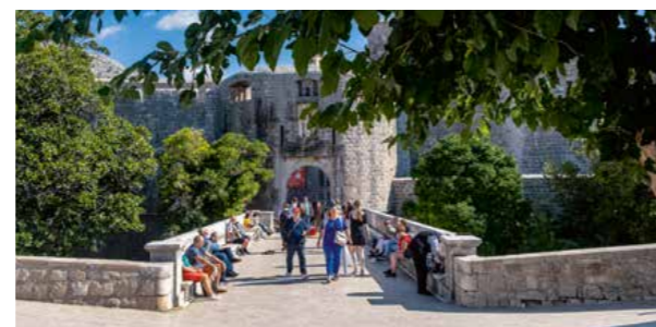
Pile Gate er en af indgangene til den gamle bydel. Her vrirler der typisk med mennesker

re. Vi forventede, at Dubrovnik var turistfattig uden for højsæsonen, men den idé gøres til skamme, da vi ankommer til den gamle bydels indgang ved Pile Gate. Uden for gangbroen, der fører ind mellem stenmurene, stimler folk sammen. Vi går hen og kigger på vandet, der dovent skulper rundt om nogle høje stenklipper, før vi følger menneskemængden og lader de store stenmure omfavne os.